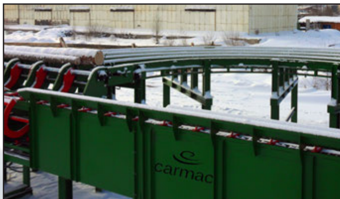
Giratronco in linea con dispositivi di caricamento idraulici

Produrre impianti per velocizzare i cicli produttivi è la nostra missione. E' possibile sfruttare la selezione tronchi per creare un parco tronchi con tronchi selezionati per diametro e girati nello stesso senso (diametro minore in avanti oppure dietro)