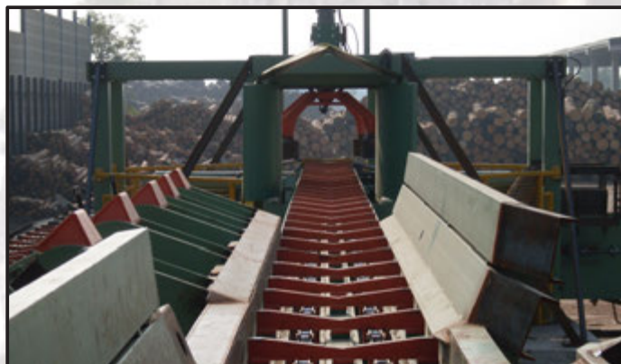
Giratronco idraulico a 90°